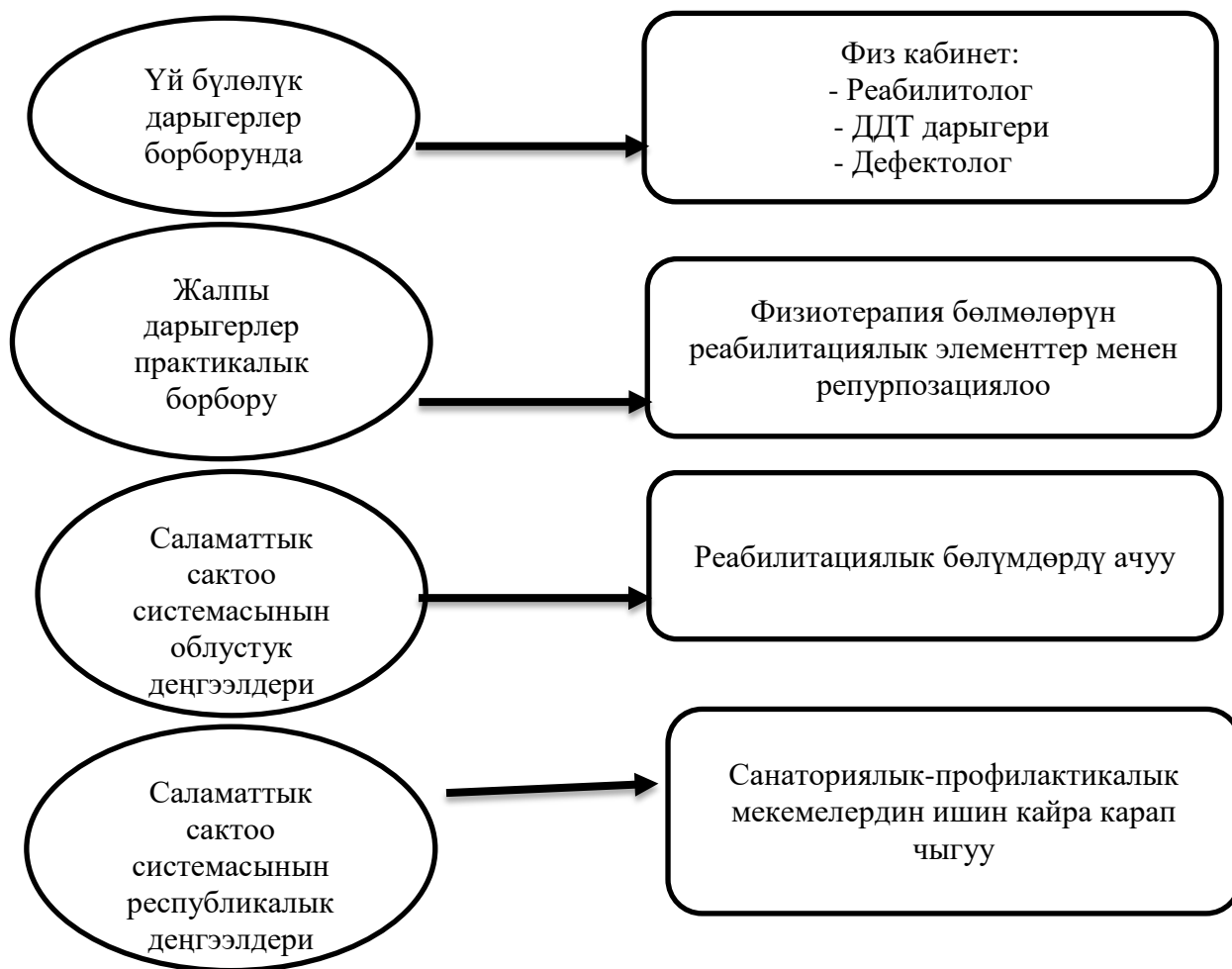
5.2.1-сүрөт – Реабилитациялык жардам көрсөтүүнү уюштуруунун сунушталган түзүмү