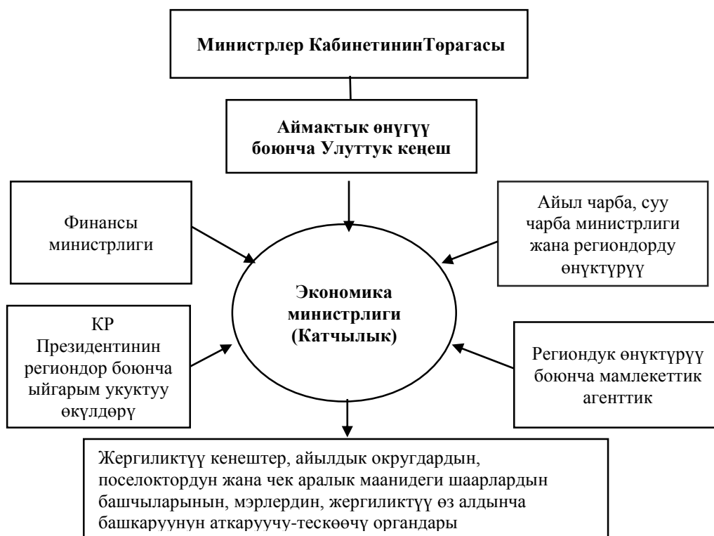
3.2. – сүрөт. Кыргыз Республикасынын региондук өнүктүрүү боюнча Улуттук Кеңешине сунуш кылынган модели.