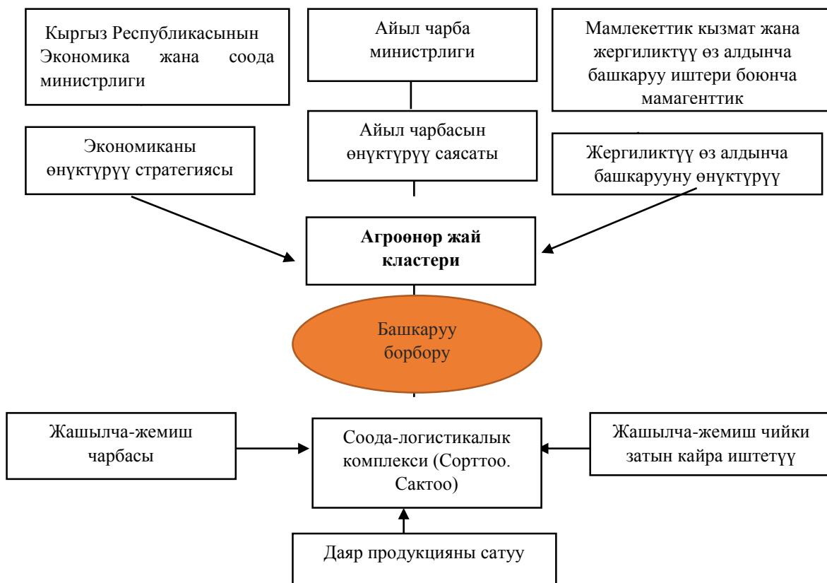
3.1-сүрөт. Агроөнөр жай кластерин уюштуруу түзүмүнүн модели