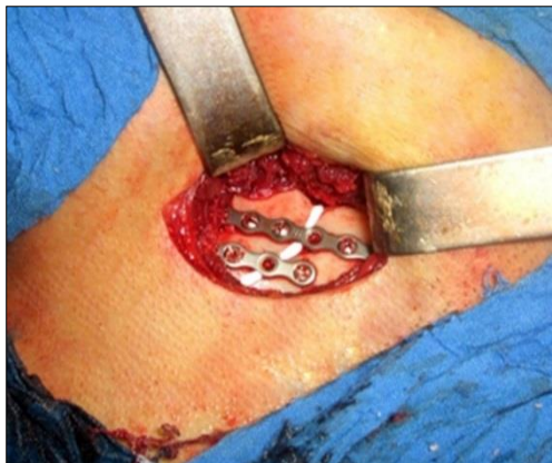
Сүр. 3. Сыныктын сызыгына «КоллапАн» гели сүйкөлүп, кичи пластина менен кадакталган.

шакекченин натыйжасында сыныкта узунунан кеткен компрессия түзүлөт (сүр. 4).