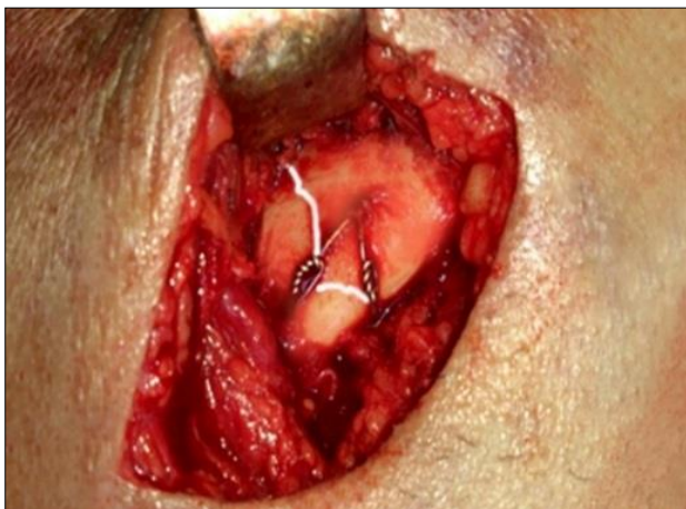
Сүр. 5. Сыныктын сызыгына «КоллапАн» гели сүйкөлүп, зым менен кадакталган.

толук кандуу тамактануу жана антисептикалык эритме – фурациллин же перманганат калия менен ооз көңдөйүн өздүк тазалоо дагы кирген.