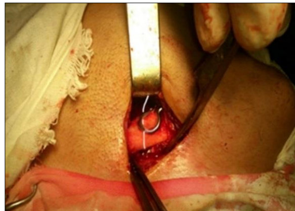
Сүр. 4. Сыныктын сызыгына «КоллапАн» гели сүйкөлүп, кайра калыбына келүүчү имплант менен кадакталган.

3 топчодогу 40 бейтапка сөөктү тигип кадактоо ыкмасы астыңкы жаактын бурчунан жана негизинен сынган сыныктарда колдонулду. Тигип кадактоо жолдору төмөндөгүдөй жүргүзүлгөн: бул үчүн дат баспай турган болоттон жасалган зым керектелет. Астыңкы жаактын бурчунан терини 4,0-5,0 см узундукта кесип, сөөктүн жараат алган бөлүгүн ачып, сынык сызыгынын сырткы жана ички эки тарабынан 1,5-2,0 см аралыкта сыныктын сөөк бөлүкчөлөрү чел кабыгы эки тарабынан ажыратылат. Жумшак ткандардын интерпозициясы жоюлуп, сыныктын арасына жана сынык сызыгына гидроксиапатит «КоллапАн» гели сүйкөлөт. Сыныктын бөлүктөрү ордуна коюлат жана сөөк тигилип кадакталат. Сөөктүн кортикалдык катмарынын ички жана тышкы бөлүгүнөн тешикчелер жасалат. Мындан кийин зым өткөрүлүп, ал астыңкы жаактын сырткы жагына буроо жолу менен бышытылат. Бышытуу 8 санына окшоштурулуп же Х формасында кайчылаштырылып, же жарыш ( = ) формасында кадакталып жасалат. Жараат кабаты менен тигилип, асептикалык таңуу жасалат (сүр. 5.)