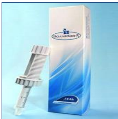
Сүр. 1. Гидроксиапатит «КоллапАн» гель.

Астыңкы жаактын ачык сыныктарын комплекстүү дарылоодо, биз, төмөнкү инновациялык усулдарды колдондук: жаак сыныктарынын сызыгына гидроксиапатит «КоллапАн» гелин толтуруу жана операциядан кийинки учурда электрдик термелтип укалоо. Жаак сыныктарына жана айланасындагы жумшак ткандарга, биздин электрдик термелтип укалоочу түзүлүш колдонулду. Ал түзүлүш төмөнкү бөлүктөрдөн турат: электрдик термелтип укалоочу түзүлүш батареясы менен. Электрдик термелтип укалоо ыкмасы төмөнкүдөй жүргүзүлдү: жаак сыныктарынын айланасындагы териге жабышуучу пластырдын жардамы менен термелтип укалоо аппараты (100 Гц термелүү жыштыгында) жабыштырылды. Бул түзүлүш зым менен оорулуулардын көкүрөк чөнтөгүндөгү батареяга туташтырылат (сүр. 2). Бул түзүлүшкө Кыргыз Республикасынын № 134, 30.11.2011 ж. берилген патенти алынган.