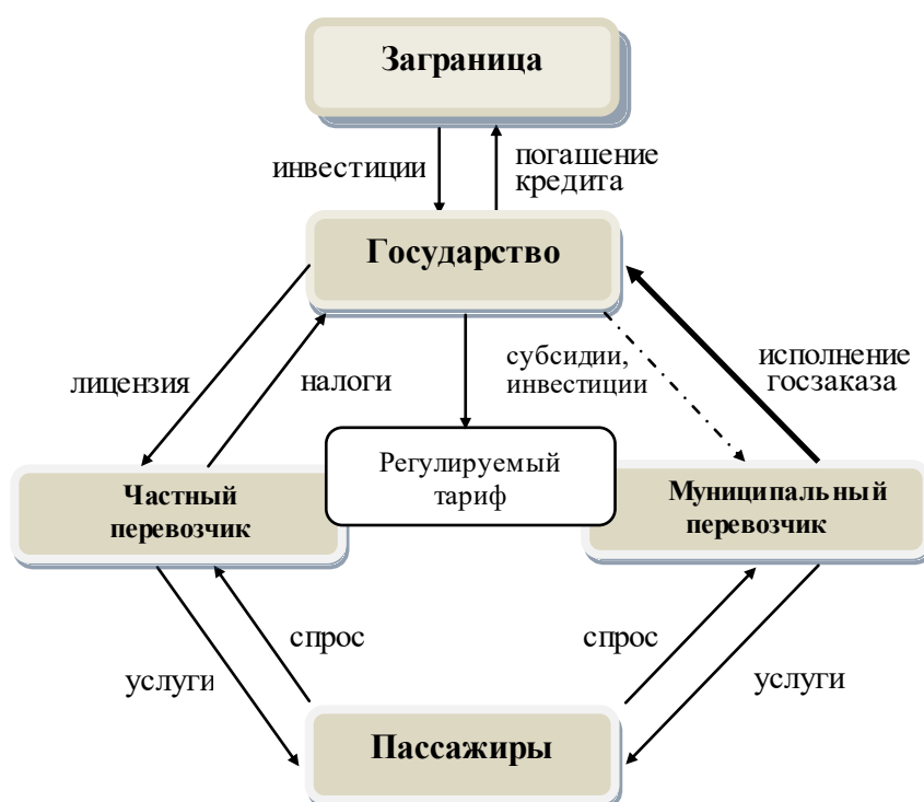
Рис. 3.1. Схема организации городского пассажирского транспорта

пассажиры участвуют в этом процессе использованием услуг пассажирского транспорта, регулируемым государством.