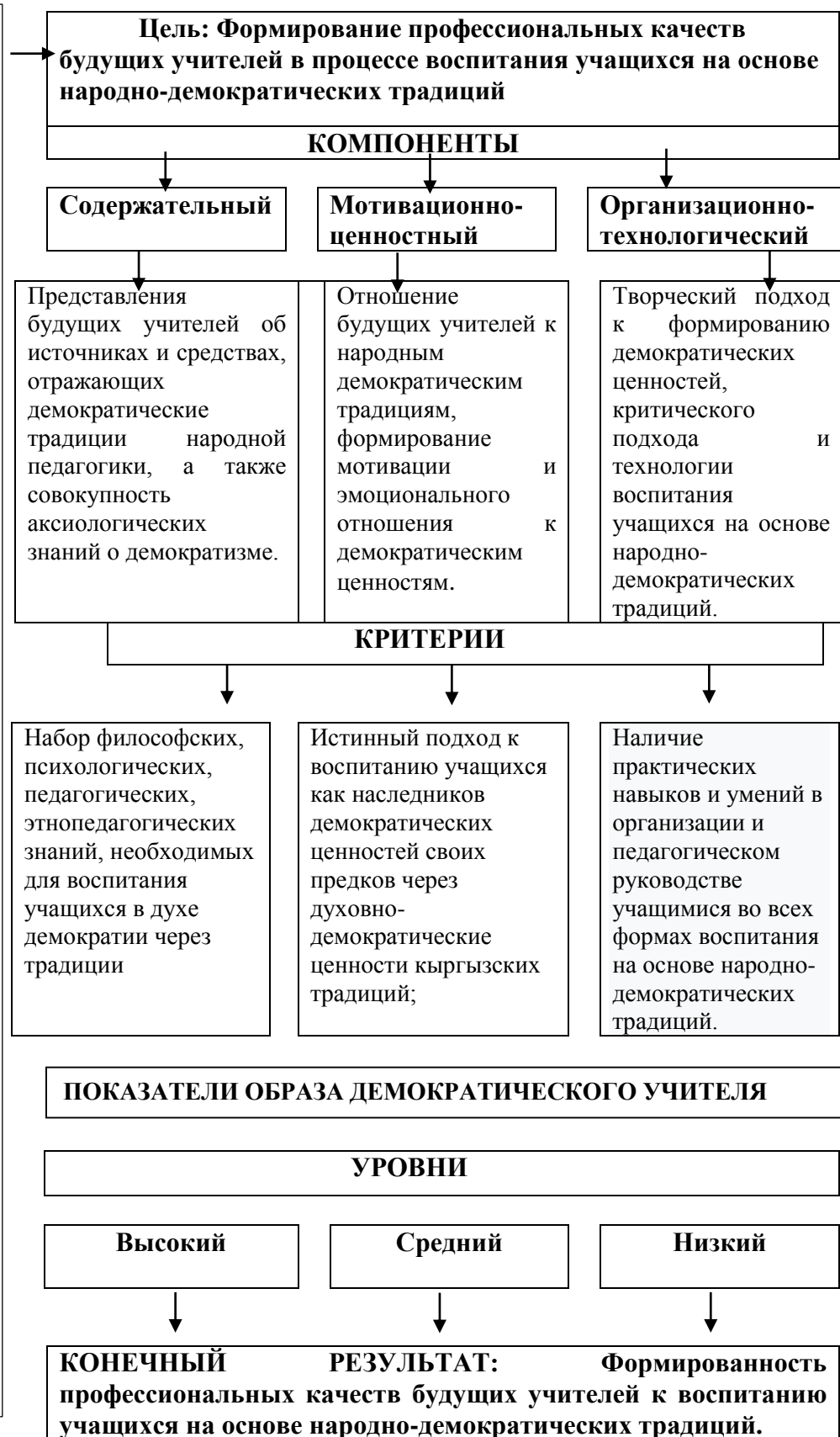
Рис.1. Модель формирования профессиональных качеств будущих учителей в процессе воспитания учащихся на основе народно-демократических традиций.