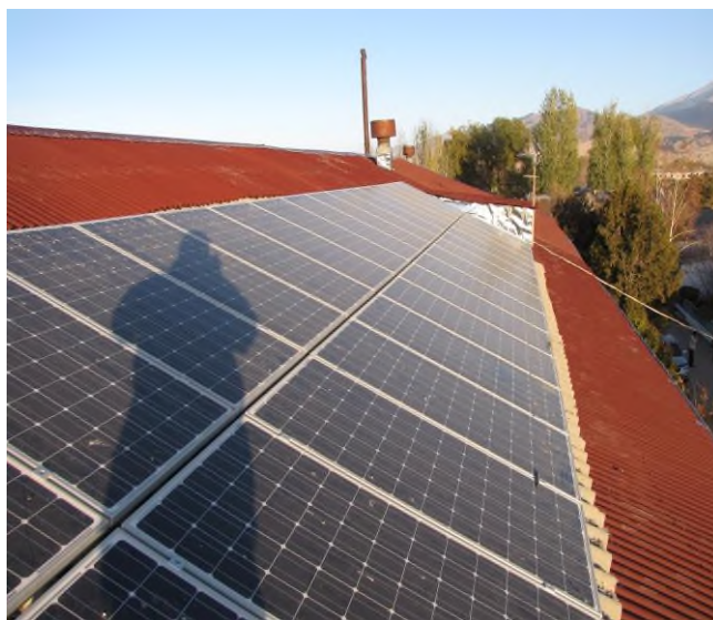
Рис.3. Фотоэлектрические станции, установленные в Тонской ТБ

количестве от 28 до 32 штук в зависимости от объекта (рис 3). Производитель панелей китайская фирма LINUO POWER, модель LN180(36)M-190.