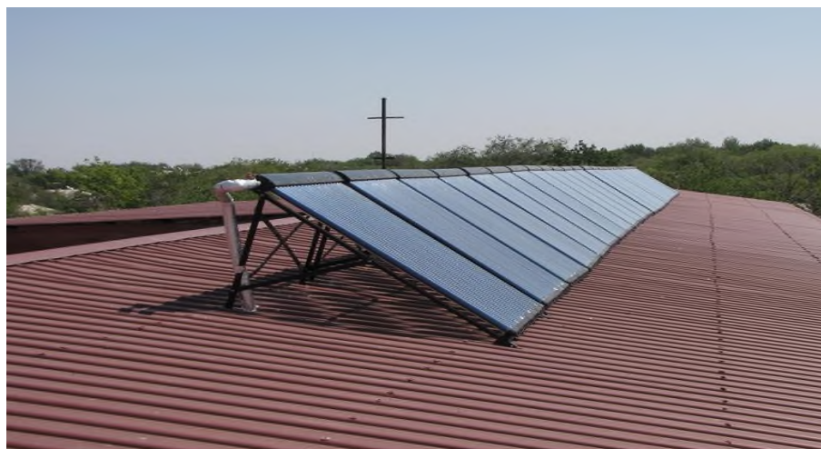
Рис. 2. Поле из 24 солнечных коллекторов, установленных на крыше роддома Жайылской территориальной больницы

тепловыми трубками (рис. 2). Солнечные коллекторы работают на четыре бака аккумулятора, объем каждого – 1 \text{ м}^3 , суммарный объем баков равен 4 \text{ м}^3 .