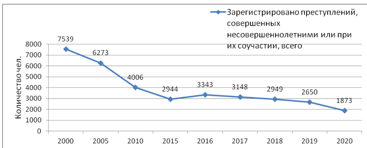
Рис. 1 Преступность несовершеннолетних в РК за период с 2000 по 2020 годы