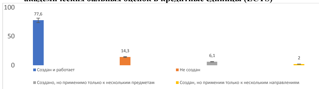
Диаграмма 2.1 – Установлена ли в учебном заведении система перевода академических балльных оценок в кредитные единицы (ECTS)

При обращении к респондентам с вышеуказанным вопросом 60% созданы и работают, 14% созданы, но только в нескольких областях, 12% затрудняются ответить, 8% не созданы, 6% созданы, но только по нескольким предметам.