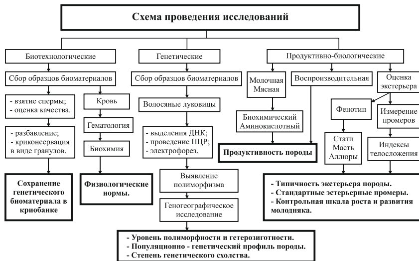
Рисунок 2.1 - Схема проведения исследования.

Объектом исследования роста и развития молодняка являлись сформированные группы жеребчиков и кобылок по 10 голов, всего 20 голов из двух регионов – южный и северный.