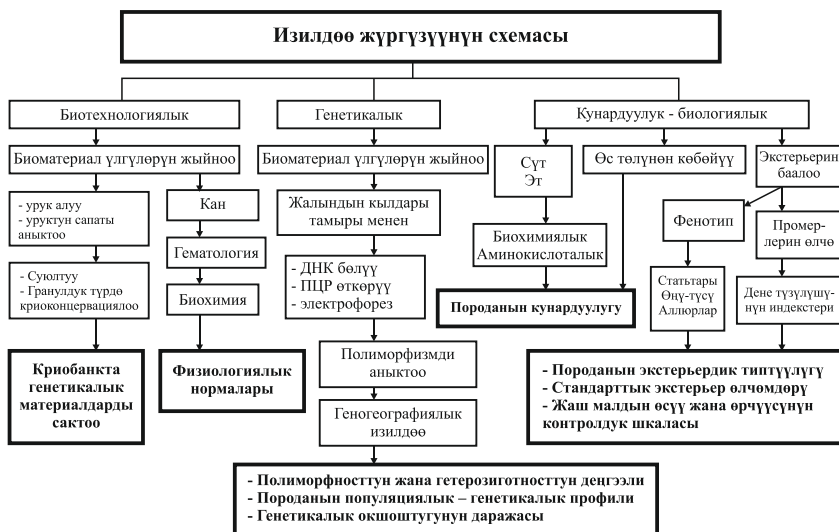
2.1-сүрөт. - Изилдөө жүргүзүүнүн схемасы.

Жаш малдын өсүп-өнүгүшүн изилдөө объектиси болуп эки аймактан – түштүк жана түндүк аймактардан 10 баштан, бардыгы 20 баштан топтор түзүлдү.