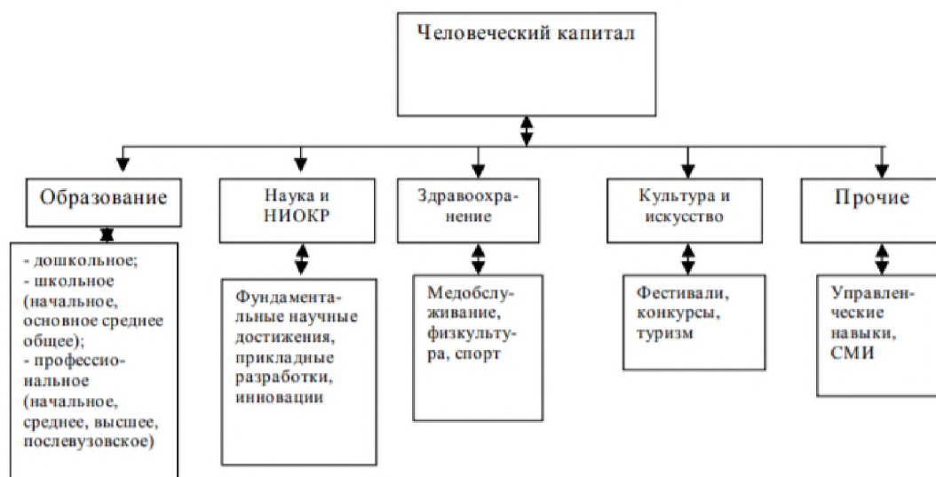
Рис. 1.2. Системные элементы человеческого капитала*