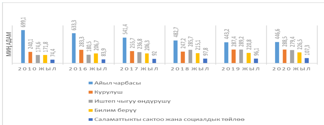
2.1-сүрөт. Кыргыз Республикасынын экономика секторлорунда жумуш менен камсыз болгондордун санынын динамикасы

Жумуш менен камсыз болгондордун көпчүлүк саны айыл чарбасына, дүң жана чекене соодага, өндүрүшкө жана курулушка туура келет. Каралып жаткан мезгилде республикада калктын жумуш менен камсыз болушунун абсолюттук өсүшү 201,5 миң адамга барабар, ал эми өсүш арымы 109,0 %ды түздү. Ошол эле учурда экономикалык ишмердүүлүктүн түрлөрү боюнча жумуш менен камсыз болгондордун катышы өзгөрдү, бул 2.1-сүрөттө көрүнүп турат.