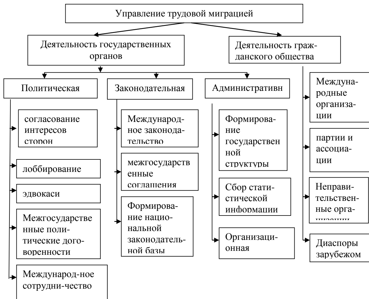
Рис. 3.1. Модель управления процессами трудовой миграции.

Предлагаемая модель диссертантом, дает описание системы управления миграционными процессами и описывает границы управленческой деятельности официальных государственных органов, место и роль в этом процессе институтов гражданского общества , а также, основы стратегической, организационной и практической деятельности в данной сфере. Эта модель объединяет: