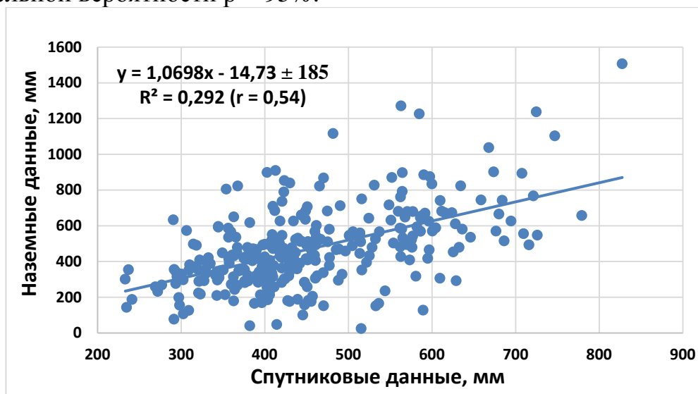
Рис. 3. График корреляционной зависимости годовых сумм осадков по спутниковым и наземным наблюдениям для 35 МС Кыргызстана за период 1998-2006 гг.

Как видно, в этом случае получен коэффициент корреляции r = 0,54 , что говорит о наличии средней по силе корреляционной связи спутниковых и наземных данных, а уравнение регрессии статистически значимо на уровне доверительной вероятности p = 95\% .