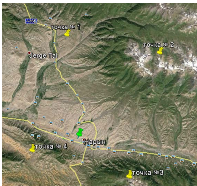
Рис. 2. Пример выбора для метеостанции Нарын показательной точки № 4 из окружающих станцию 4 близлежащих узлов сетки (см. табл. 1), которые использовались при комплексном анализе спутниковых данных ТМРА-3В43