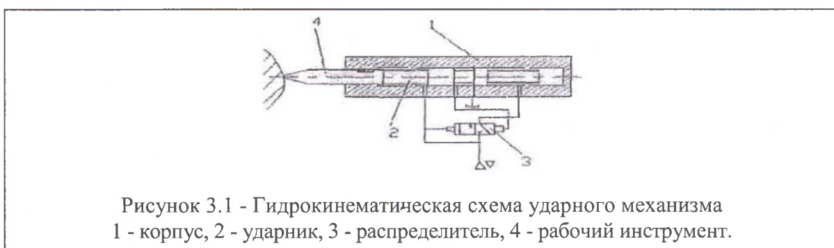
Рисунок 1. Пример оформления рисунка.

3.14. Иллюстрации при необходимости могут иметь наименование и пояснительные данные (подрисуночный текст). Слово «Рисунок», его номер и через тире наименование помещают после пояснительных данных и располагают в центре под рисунком без точки в конце (рисунок 1).